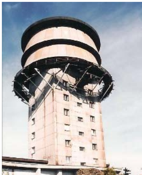
Zvon těsně po skončení studené války

Vojáci měli ve zvyku vrchol pojmenovávat jen Zvonem, ale správně by se měl nazývat celým názvem Velký Zvon , protože v jeho blízkosti se nachází druhý vrchol s přídávkem Malý . 1