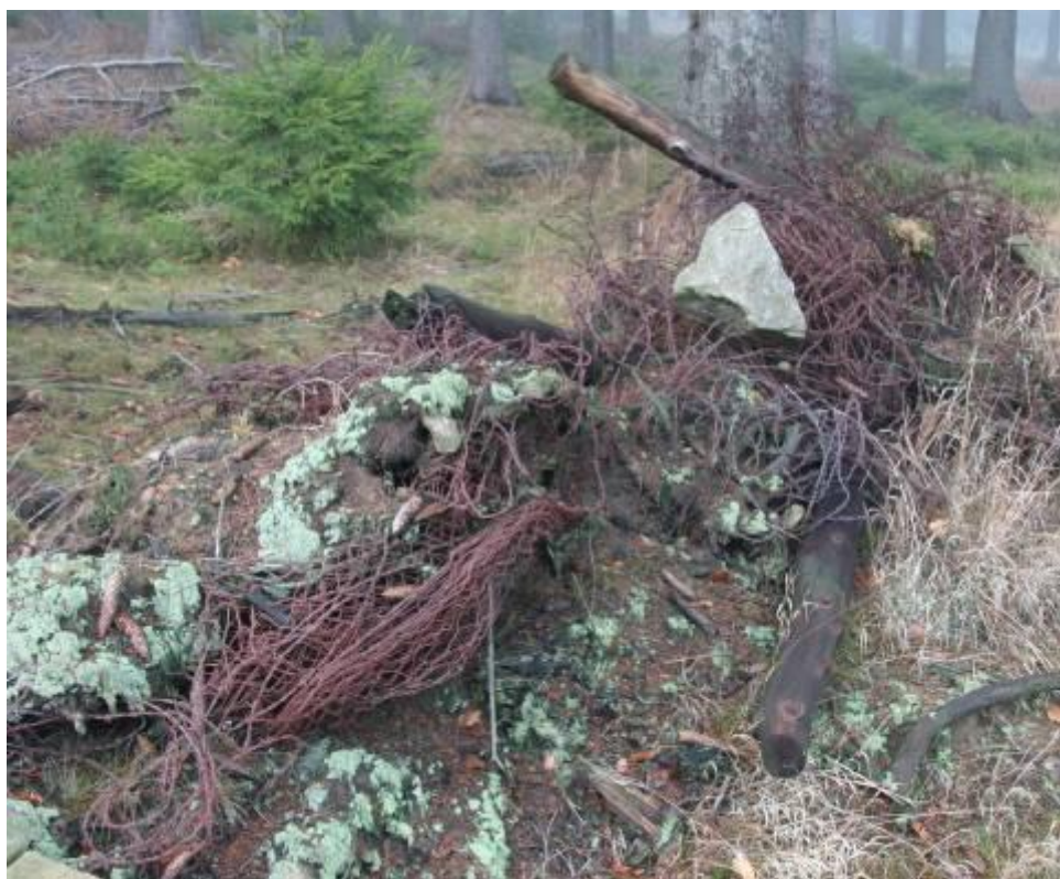
Zbytky signální stěny na stanovišti Tišina

Podobně jako na jiných stanovištích byla i zde ochrana pracovišť zabezpečena signální stěnou, vycházející z typu U-60 od Pohraniční stráže.