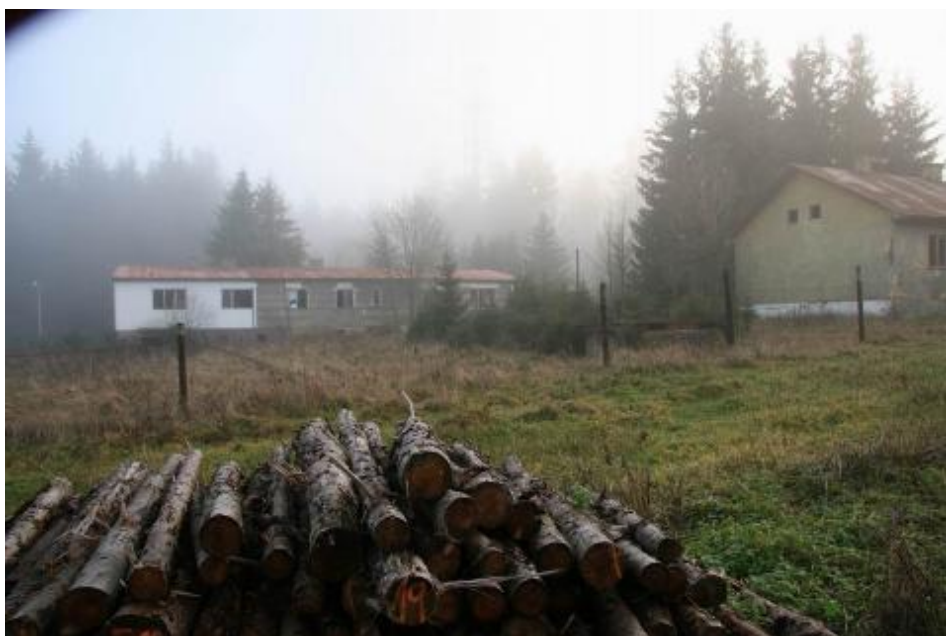
Ilustrační obrázky stanoviště Tišina

Po roce 1993 bylo stanoviště určeno – jedno z prvních – jako nepotřebné k prodeji za cenu 4.38 miliónu Kč. 9 ( Zatím nevím, kdo s koupí uspěl, ale v prostoru roty se nachází „outdoorový“ domeček poskytovatele mobilního spojení ).