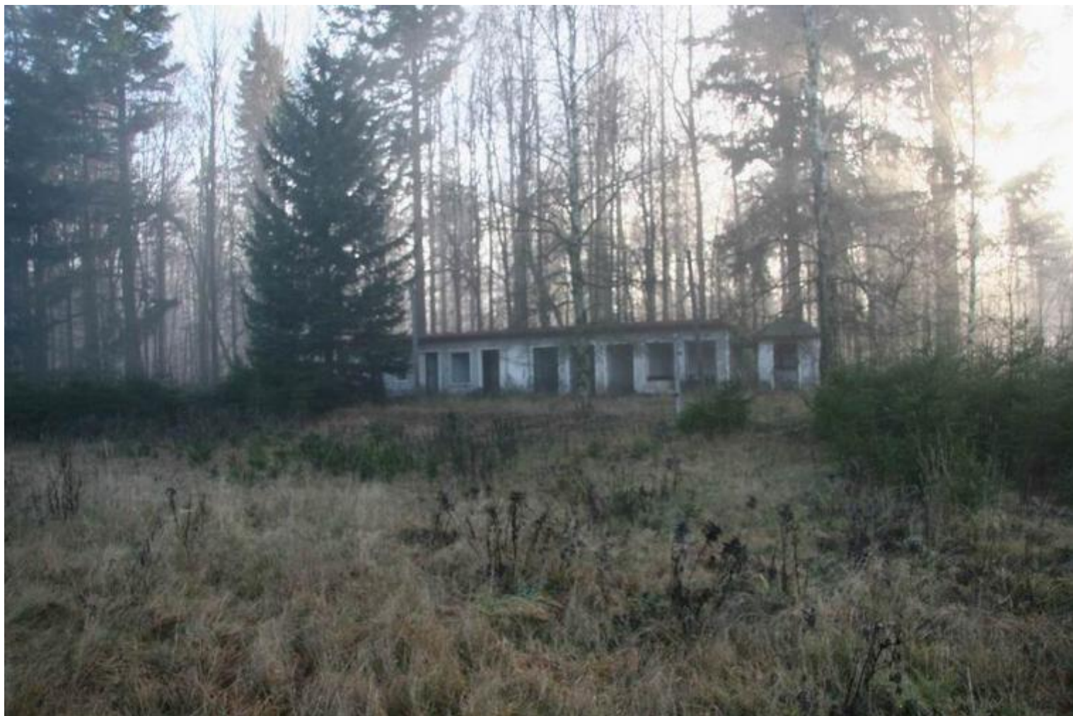
Tišina – původní kotce pro psy Pohraniční stráže, využívané rádiovou rotou jako skladiště