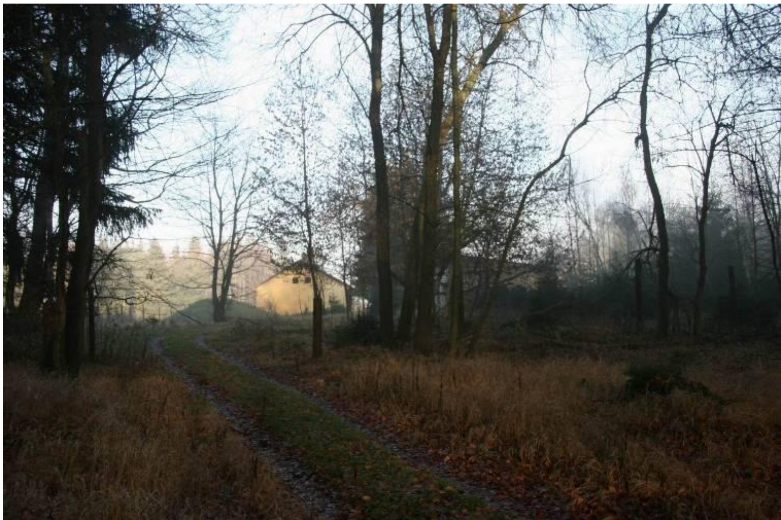
Příjezdová cesta k Tišíně

Pouze pro doplňkový průzkum byl ve „výzbroji“ jednotky přijímač Lamda V , pro odposlech americké vojenské stanice AFN 6 , kterou amíci využívali k upevnění bojové morálky svých vojsk v Evropě. Přestože to byl vlastně jen doplňkový zdroj informací, podařilo se zde zachytit dvě důležité zprávy, za které dostali operátoři mimořádné opušťáky.