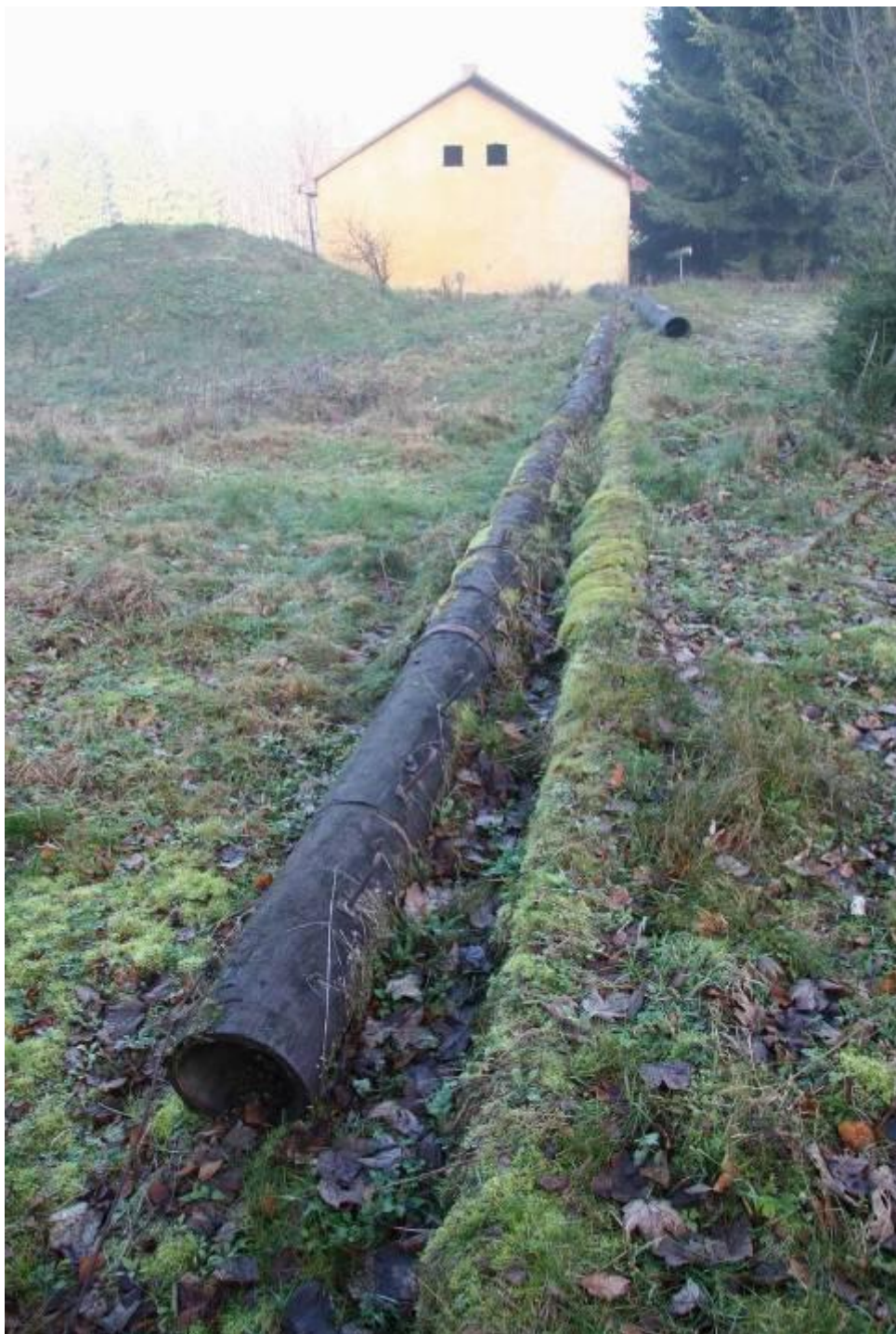
Část zlikvidovaného anténního pole na Tišině

V současnosti už nenajdete ani jediný stojící stožár, byly pokáceny zřejmě při likvidaci stanoviště (viz vedlejší obrázek).