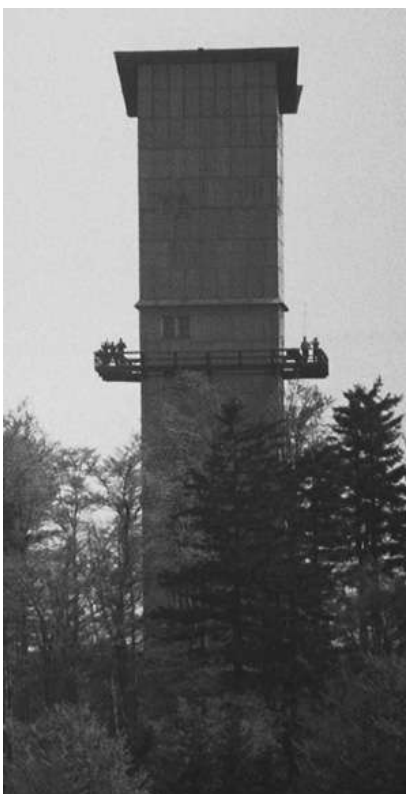
Totéž, ale z německé strany

Havran je nejvýše položeným místem okresu Tachov a klimatické podmínky – zvláště v zimě – tomu odpovídají.