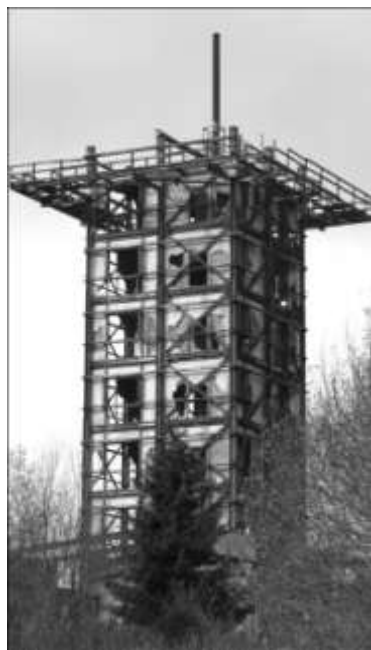
Rok 2009 současná podoba ruiny.

Za jakých podmínek se objevili vojáci na Havranu a jak vlastně vypadaly jejich začátky si přečtete v kapitole „ Havran v době studené války “. Zde najdete popis přítomnosti vojáků na vrcholu, budování první dřevěné věže i výstavbu nové výškové budovy. Kapitola končí počátkem devadesátých let překotným opuštěním západní hranice a dokoce demolicí horní (anténní) části věže.