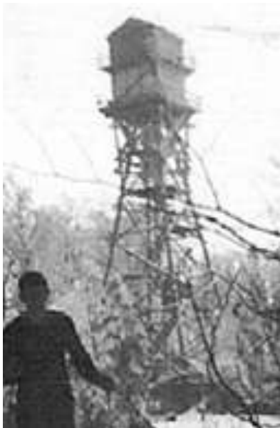
Navýšení věže z jiného pohledu