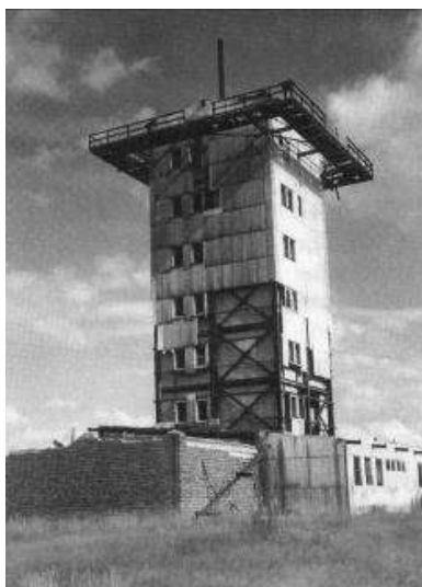
Rok 1993 Dvacetimetrová anténní nástavba je stržena, část obložení i budov ještě stojí