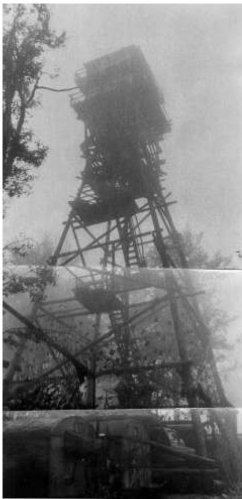
Koncem 60. let už stromy příliš povyrostly a začal být problém se signálem mikrovlnných pojítek MT-11. Proto byla výška věže svépomocí zvednuta o 10 metrů.

Ze všech bývalých vojenských stanovišť na státní hranici právě osud Havranu je nejsmutnější.