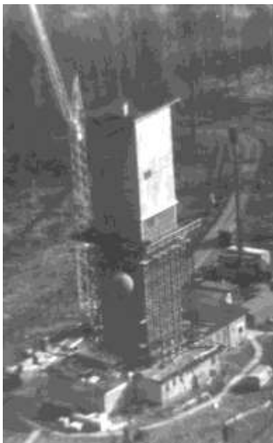
Rok 1992 Vojáci odchází, bourá se anténní nástavba