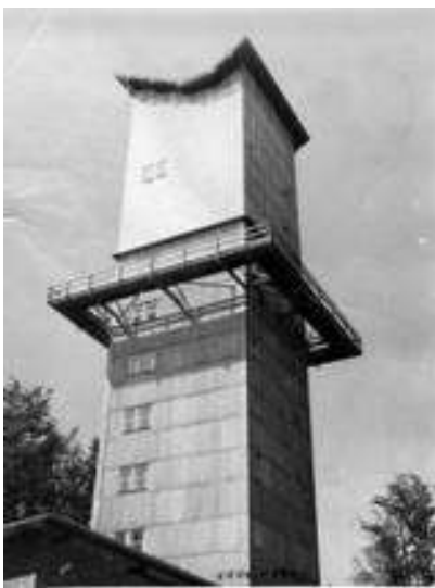
Nová věž na Havranu v dobách největší slávy