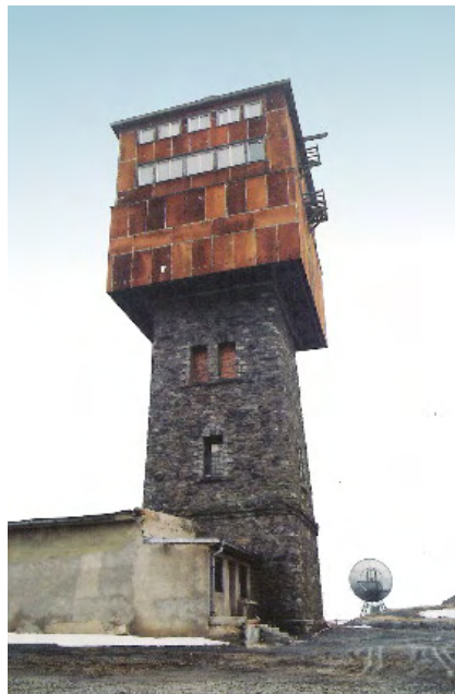
Stav stanoviště v okolí Kurzovy věže těsně před předáním turistům (cca 1999)

Místnost u paty věže sloužila jako stanoviště operačního důstojníka a šifřanta