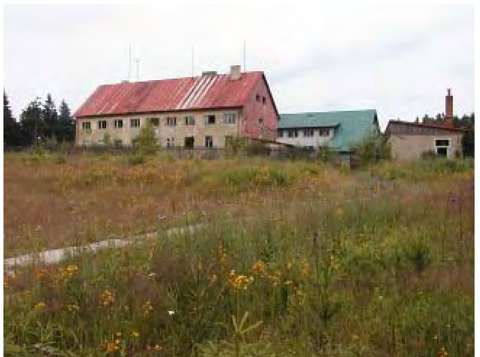
Opuštěná PS rota pod Čechovem. V popředí původní staré budovy, za nimi nová výstavba, dokončená těsně před rokem 1989.

Tyto objekty PS roty jsou zmíněny i hojně propagované knize o železné oponě pana profesora Jílka . Na doprovodných fotografiích je ovšem zaměřuje s vojenskými objekty na Čerchově.