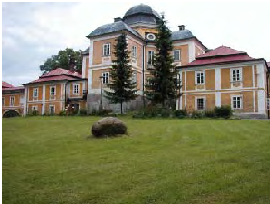
Lesní zámek Diana

Původně sklárna, později lovecký zámek, který dal místu jméno, odvozené od bohyně lovu, pochází z r. 1742. Projekt zámecké stavby, vybudované na značně protáhlém a členitým půdorysu je přisuzován J.B. Santinimu. Od r. 1960 sloužil jako domov důchodců. U zámku se rozkládá park a zrušená obora.