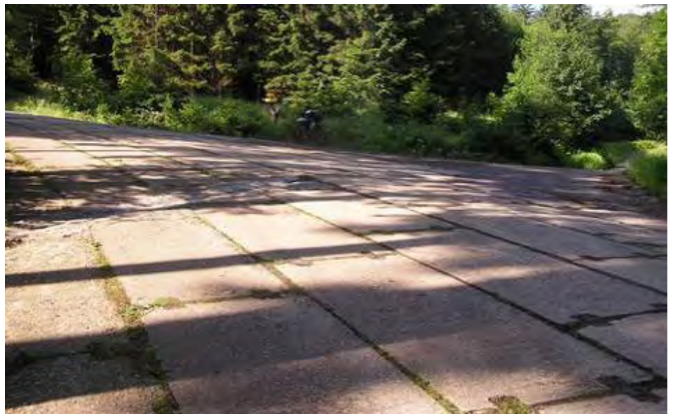
Rozcestí na Stadionce – vlevo strmě stoupající betonová „letní“ cesta, vpravo „zimní“ cesta okolo Malinové hory a roty PS