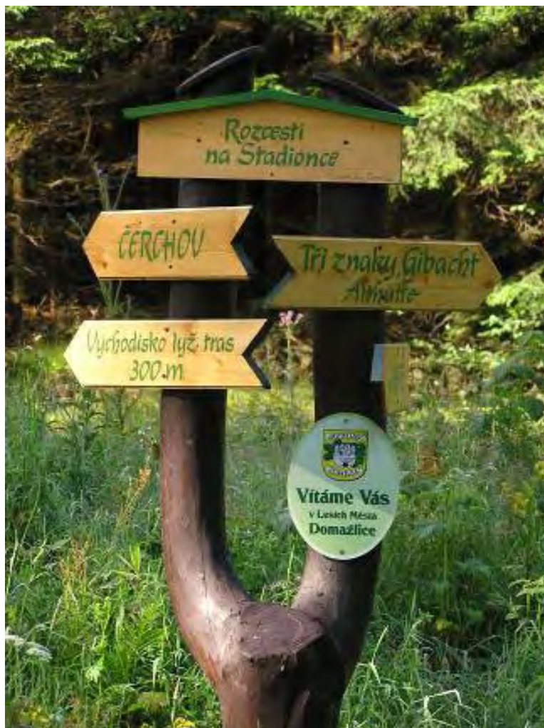
Rozcestí na Stadionce

2) Vpravo pokračuje tzv. zimní cesta, kde asi po 400 metrech opět projížděla branou v signálce a pomalým stoupáním po vrstevnici dlouze objížděla Malinovou horu a okolo bývalé PS roty se na úbočí Čerchova setkává se Stadionku.