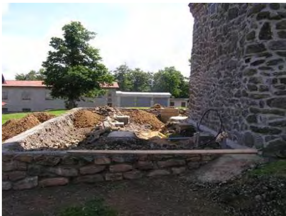
Tak vypadal v roce 2005 začátek stavby nové útulny na Čerchově...

Turisté se na Čerchově „rozhoupali“ ke stavbě útulny pod patou věže, rozestavěné už od roku 2005. Jak vypadala budova pod věží o rok později, vidíte na připojených snímcích.