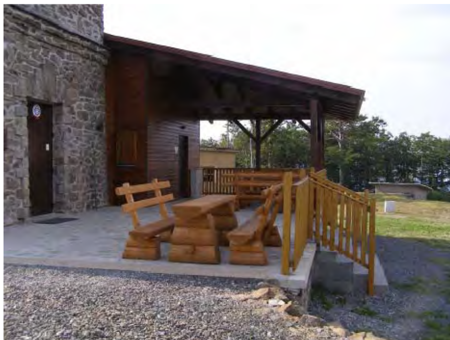
..... a takto útulna vypadá dostavěná o rok později