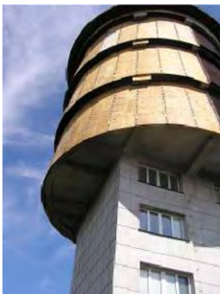
Dvě věže Čerchova

Dole a nahoře nová vojenská z 80tých let dvacátého století, uprostřed o 90 let starší Kurzova turistická věž