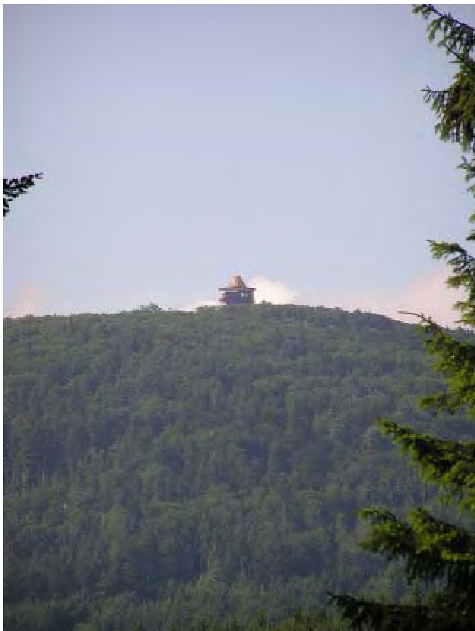
Capartická cesta na Čechov – několik set metrů za odbočkou z capartického parkoviště - poslední úsek, odkud je zdola vidět Čerchov

V době politického „tání“ druhé poloviny šedesátých let byl umožněn i opětový přístup ke sjezdovce, ale pouze v krátkém časovém rozpětí let 1966 - 1971. Nastupující normalizace opět vstup omezila.