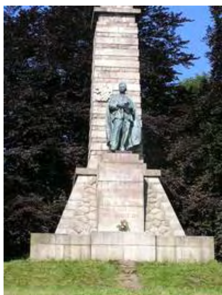
Pomník J. Š. Baara poblíž hotelu Výhledy