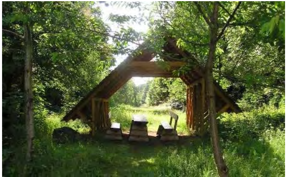
Odpočívadlo na Stadionce, v místě, kudy šla železná opona