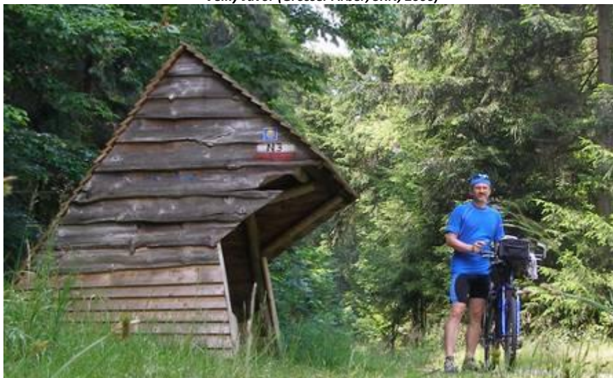
U vodního pramene a odpočívadla na cestě Bärenriegel, zpáteční cesta z vrcholu Hoher Bogen (SRN, 2006)