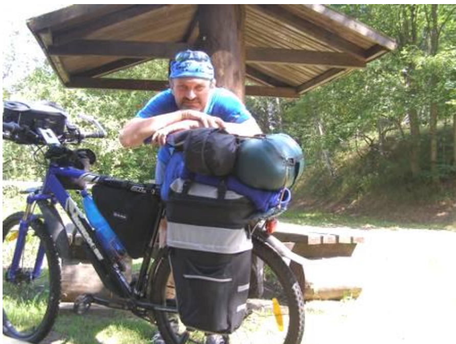
Trojmezí (Dreiländereck) – kousek území severně od Aše, kde se protínají bývalé hranice Československa, západního i východního Německa.

Jakékoli informace k této stránce, návrhy na doplnění či změnu, uložení vaší mailové adresy do seznamu kontaktů bývalých vojáků uvedených zpravodajských útvarů za účelem vzájemné komunikace, posílejte na adresu