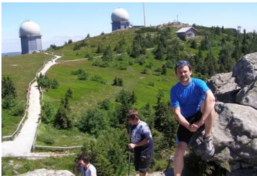
Velký Javor (Grosser Arber, SRN, 2006)

Ilustrační snímky pochází z cyklistické letní expedice roku 2006 za účelem prohlídky stanovišť bývalých „protivníků“ na německé straně železné opony.