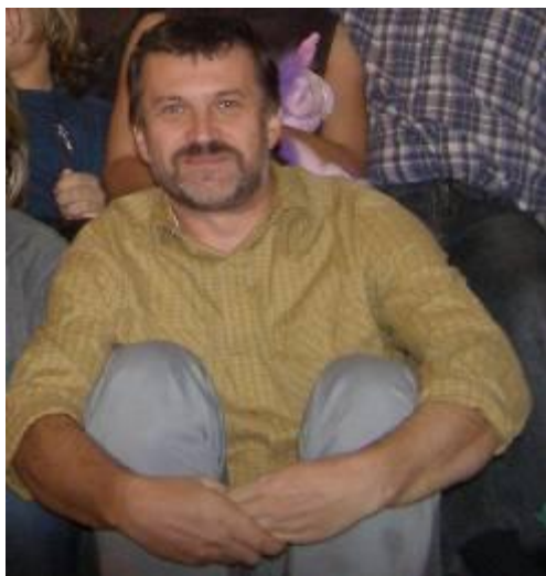
Velikonoce v Opavě (2006)

Je mi líto, že u nás neexistuje analogie veřejně přístupného německého muzea signálového průzkumu . Když totiž odhlédnu od té všeobjímající komunistické ideologie, myslím, že se – coby vojáci-technici - za období od šedesátých let nemáme moc za stydět.