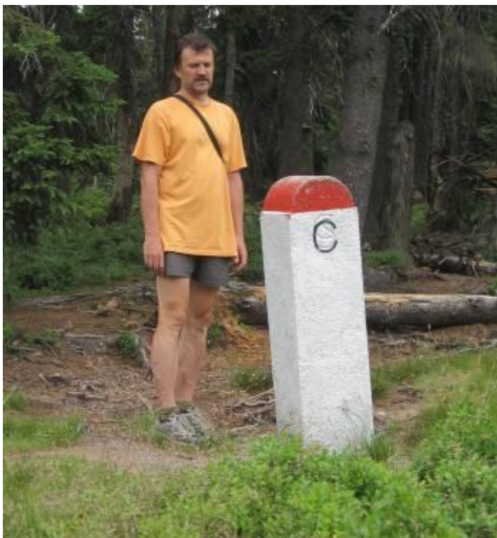
Za dobu mého života se už 3x změnil název republiky....