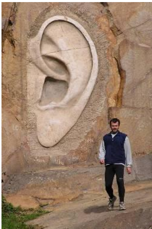
Autor webu u národního památníku (policejního odposlechu) (Bretschneiderova ucha) nedaleko Lipnice nad Sázavou (2005)

Z armády odcházím po 20 letech v hodnosti majora a ještě v období aktivní služby se začínám zabývat genealogií a regionální historií , které mají s mou tehdejší profesí mnoho společného – pečlivé bádání, analyzování maličkostí, jejich spojování do větších celků, práce s archivními údaji.